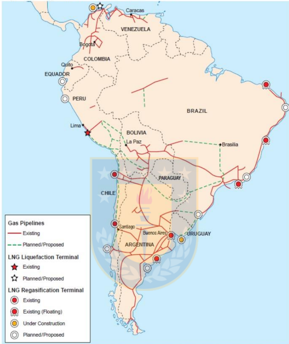
Map 1: Natural gas infrastructure in South America, 2016

Note: The list of "Planned/Proposed" LNG Regasification Terminals represented in this map is not exhaustive