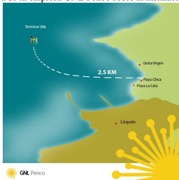
Imagen 2 155